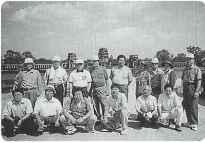
〔アンコールワット〕

カンボジアに行くことが決まったとき多くの人は、そんなあぶないところへ行つて大丈夫？と心配してくれました。でも何事もなく行つてこれた事、またこの研修旅行がすべて良い思い出になった事、皆さん異口同音に良かった、良かったと言う事間違いないと思います。そして、カンボジアまで行つた人はあまり多くはないと思います。