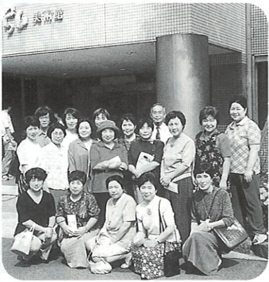
徳川三代日光路の旅 今市市お菓子の城と たまり漬本舗見学

また、一番嬉しかった事は、一人暮らしの高齢者の方々と、絵手紙を通して交流が出来大変喜んで頂いた事です。励まし合い、助け合う中で組織作りに向け大きく前進出来たと確信致しております。