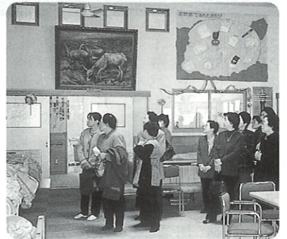
ゆとり荘慰問 清拭布を寄付 (十二月十三日)

九月十日、十一日、役員研修が行われ、今市のお菓子の里や、たまり漬本舗見学の小さな村に「星野富弘美術館」を見学。口に絵筆をくわえ描いた草花と詩に感動と勇気を頂き、一路鬼怒川へ行き一泊。翌日は日光東照宮参拝と歴史を学び、楽しく有意義な研修でした。