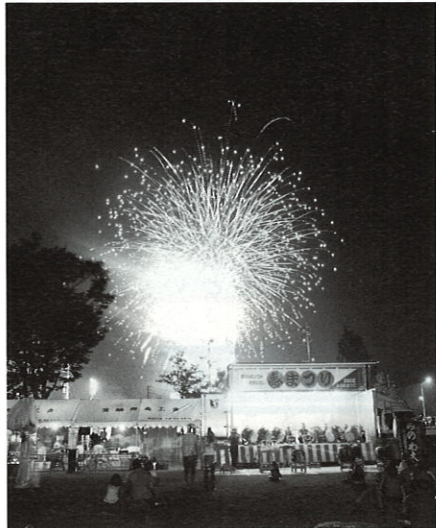
前夜祭クライマックス打上花火