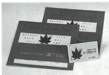
お買物は、みのわメーブル会 加盟店をご利用下さい。

みのわメーブル会（山口市秋会長、加盟店八十四店）は、ポイント・スタンプ五倍セールを八月五日（月）から十三日（火）までの九日間行いました。 日頃の愛顧に感謝を込めた特別企画。十二月には共通商品券引換セール、来年二月頃には観劇の旅（帝国劇場、宝塚など）を予定しております。消費者の皆様にご喜んでいただけるサービス事業を企画中です。メーブルポイント・スタンプは、加盟店にて通常一冊