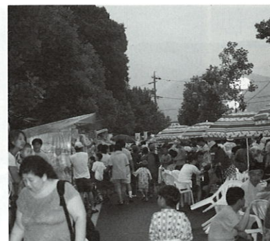
大賑いの出店広場