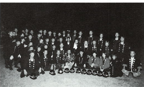
恵奈手筒会の皆さんと

が「夢」を持ち、地域に生きてゆく「誇り」を持たたいという事は、今後の企業経営を担い、苦境を乗り越えて行くために非常に大きな意味があったと思います。 平成十一年度から始めたまちづくり事業の視察研修の中で恵那の手筒イベントの話にヒントを得て、地域おこしにつなげようと研修や練習を繰り返し、ようやくここまでたどりついたのです。 もう一つは部員の輪。練習の回を重ねる毎にどんどん参加者が増えました。 青年部ではこの団結を活かし、今度はリサイクルロボットづくりに挑戦します!!