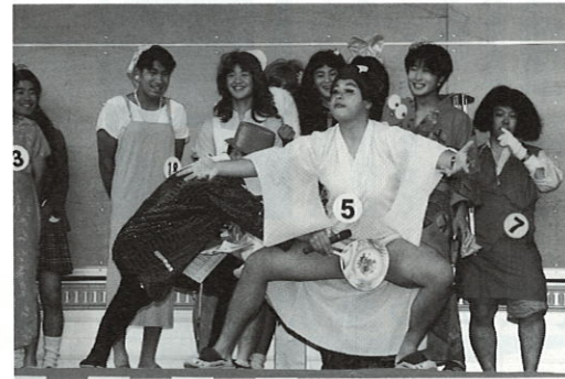
Mr.レディ&Missダンディコンテスト