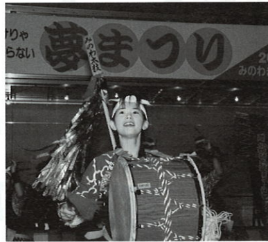
みのわ太鼓が盛り上げる