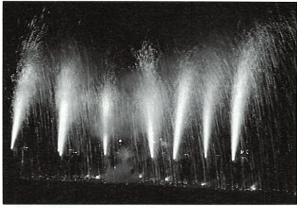
みのわ手筒会花火打上の勇姿

青年部では、「低迷する経済環境の中で、自分らのできる何かがないだろうか」という意見から、町の活性化に役に立てればと昨年から模索を始め「子どもから年配の誰もが癒され、心の中に残るものは？」と、『花火どう？』、その中で近隣市町村に無い『手