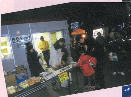
あたたかい食べ物を手にイルミを 楽しんでいただきました。