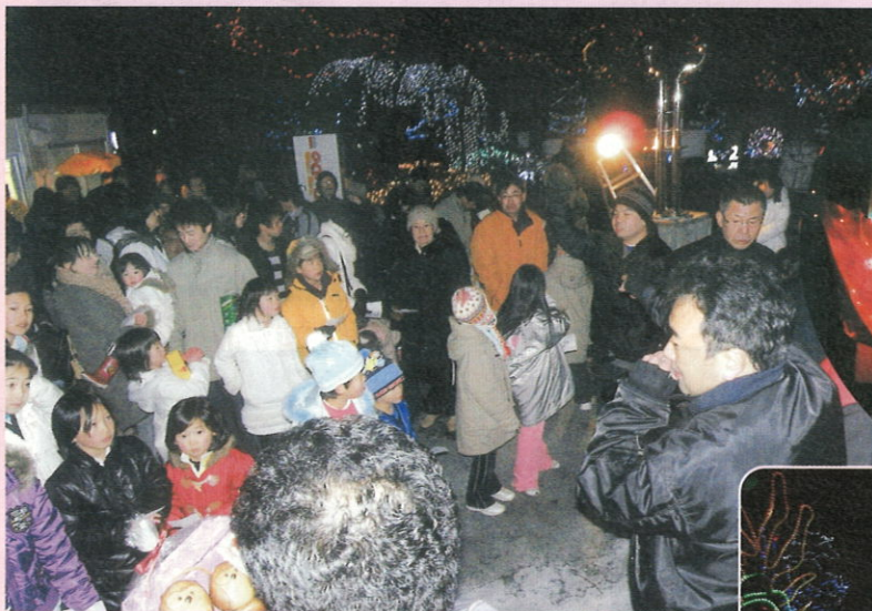
広場のイベントには沢山の方にきていただきました。