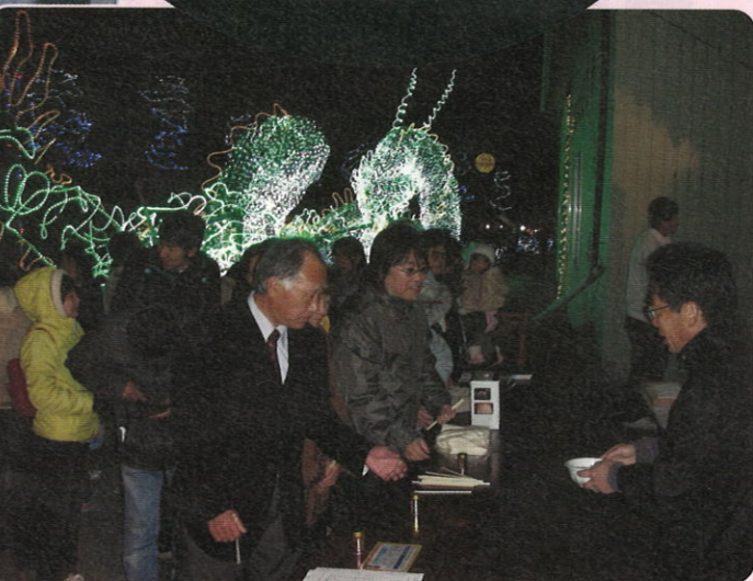
人の列が切れることなくイルミも出店也大盛況!!