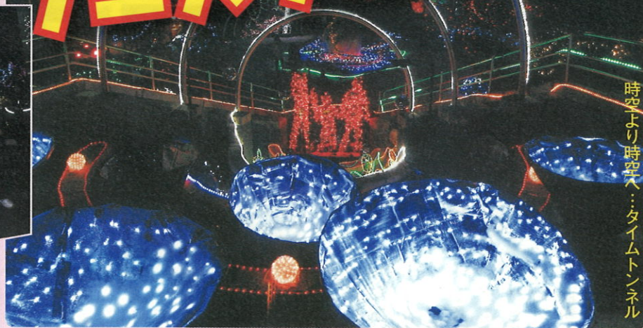
時空より時空へ：タイムトンネル