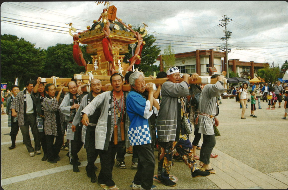
元氣作りは商工会から！不景気風を吹き飛ばせ