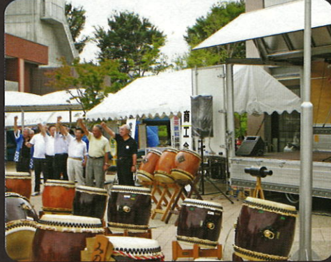
まつりがスタート、エイエイオー！