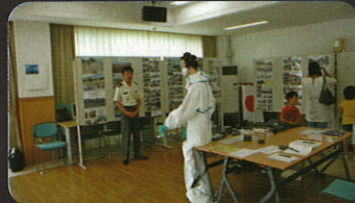
自衛隊復興支援活動展示