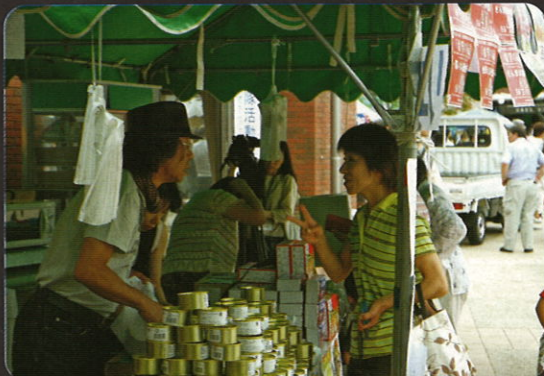
被災地支援「希望の缶ヅメ」2つ下さい