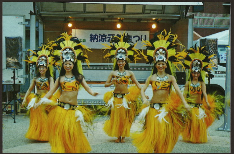
フラダンス、タヒチアダンス、地元音楽グループなどが一日中祭りを盛り上げる