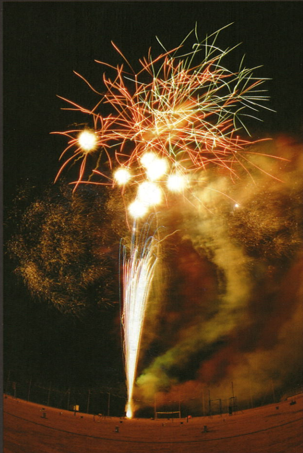
10周年の手筒花火が協賛打ち上げ

「不景気と震災の影響で町全体に沈滞ムードを払拭するのは、私たち商工会。」という使命感から祭りは始まり、お力ネをかけず、自己責任自主参加と手づくりを基本方針としました。 準備期間二カ月、実行委員・出演者・出店者などの参加者総数六百余名、出店十九店、出演二十二団体で、四ステージ併行の多彩なプログラムに加え十周年の手筒花火がフィナーレを飾りました。 祭りのもうひとつの趣旨であった被災地支援についても、義援金三十万円以上を送ることができました。皆様方のご協力に対しあらためてお礼申し上げます。