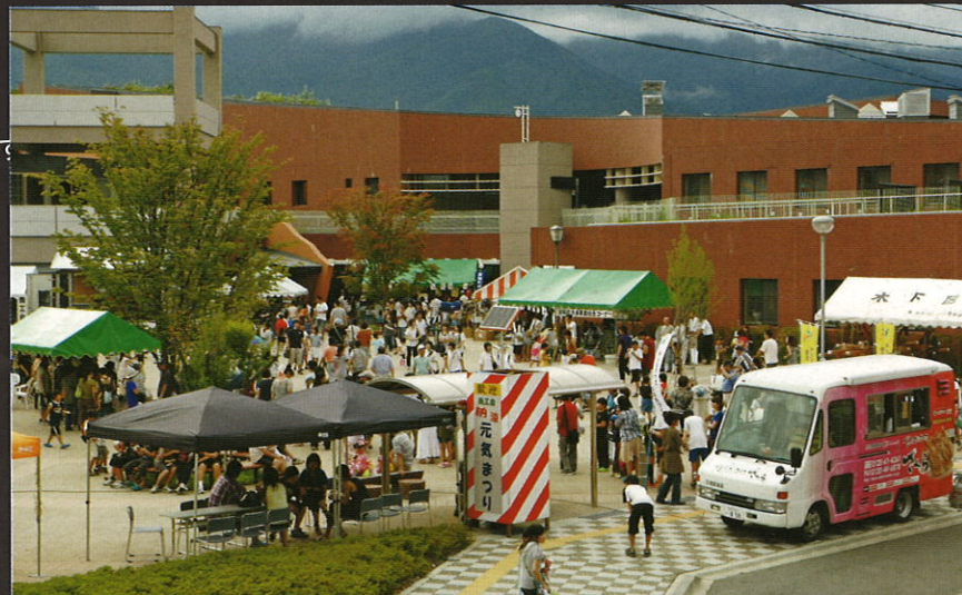
交流広場にはまつり終了までお客様があふれた