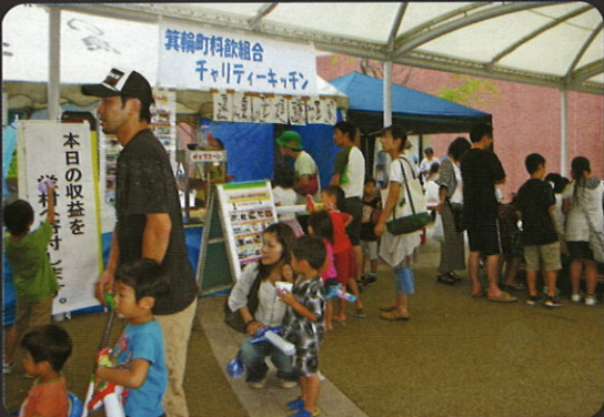
飲食テントには長蛇の列が