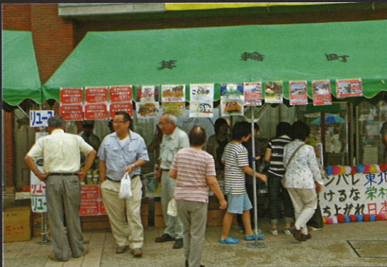
大震災被災地物産のお買上げありがとうございます