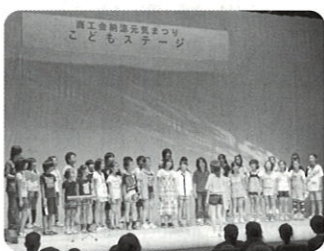
13グループ約400名が出演したこともステージ

企画が決まってからお祭り当日までの期間が少なく、皆が持てる時間を精一杯使って準備を行いました。ステージ発表会には青年部として初めての試みに皆で挑戦いたしました。全員のお祭りを盛り上げたいという気持ちと地域の皆様のご協力があり、大成功だったと感じました。