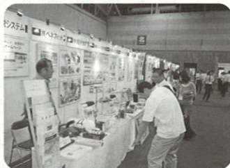
厳しさの感じられたモノづくり展

7月6日 〜8日の3日間、ポトメッセなごやで開催された展示会に今年も参加しました。