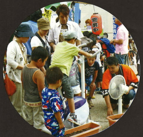
青年部「こども広場」こどもステージ・ゲームコーナー・飲み物販売・自転車発電体験