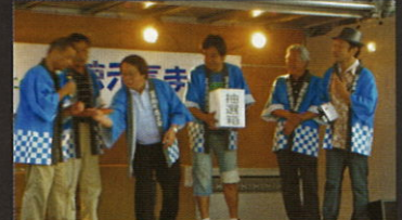
大抽選会の1等賞は誰だ？