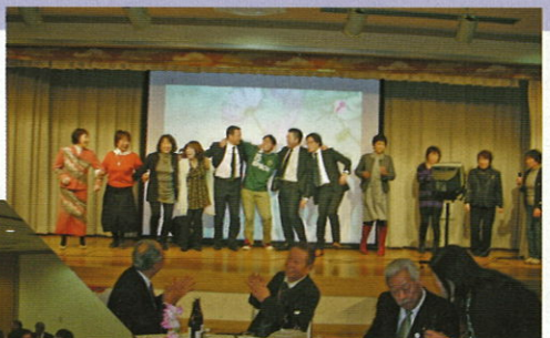
▲ゲストを巻き込んだ女性部一同による365歩のマーチ

講演会終了後、会場を一階に移し新年会を開きました。町長はじめ議員他ご来賓に加え、講演会講師や松本山雅関係