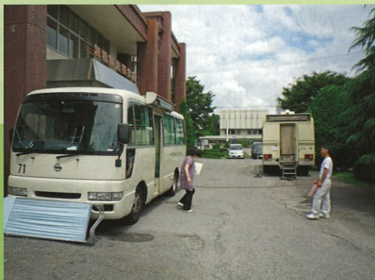
健康診断には助成金が支給されます。

なお、ご加入いただいている方々への利益還元事業の一環として、「共済加入事業所向け健康診断事業」なども実施しております。ぜひ有効にご利用下さるようご案内申し上げます。