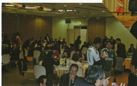
▼招待客、役員、会員の交流で何かが始まる予感

者も加わり、総勢90名程の盛会となりました。 会員の親睦や交流をより深めるために、後半にはカラオケ大会の余興も加えました。予め申込んだいた会員が少なく心配したのですが、興が乗るにつれ続々と飛び入りがあり、また山雅応援歌も飛び出し、厳しい現実をひと時忘れ、賑やかで楽しい語らいの時間となりました。