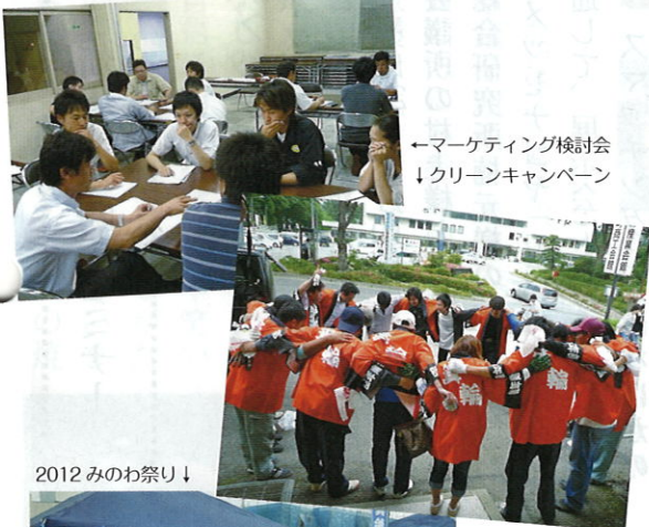
←マーケティング検討会 ↓クリーンキャンペーン

困っても困らない青年部が大好きです。今年度青年部のスローガン「イエス・ウィー・キャン！」を実感出来た祭りでした。