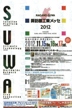
諏訪圏工業メッセ・2012