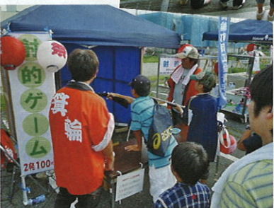
2012 みのわ祭り ↓