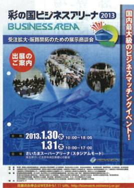
彩の国ビジネスアリーナ・2013