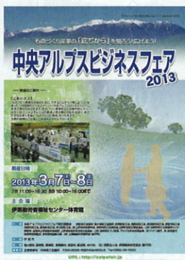
中央アルプスビジネスフェア 2013