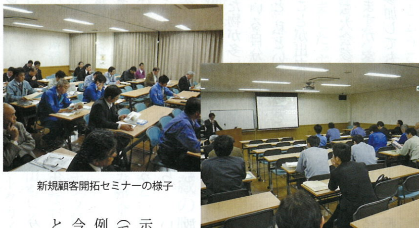
新規顧客開拓セミナーの様子