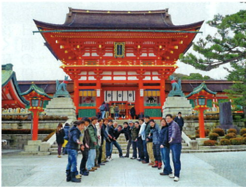
京都伏見稲荷大社にて「商売繁盛祈願の記念撮影」