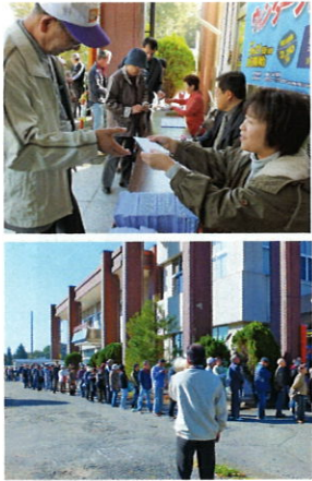
↑販売開始前の大行列の様子

今年2回目のウィンタープレミアム商品券を10月21日(日)午前9時より商工会館特設窓口にて発売しました。今回も額面1,000円券11枚綴りを1万円で購入。お一人様販売限度額10セット(10万円)使用期限12月31日までとして、2,000セットを御用意しましたが、販売となる大盛況でした。(取扱登録店106店) 今回はみのわメープル会加盟店でプレミアム商品券にて買い物をした方50名に抽選で3,000円分のポイントが当たる協賛企画もあり、大変好評でした。