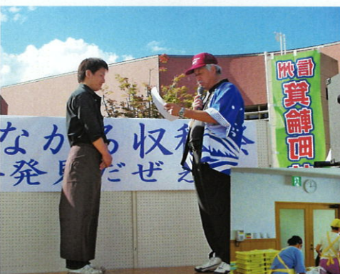
↑コンクール投票第一位！表彰式