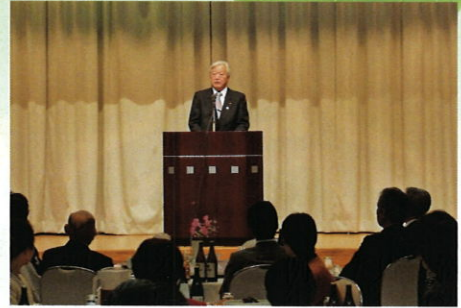
日時：1月26日（土）17時～21時 会場：伊那プリンスホテル 「商工会会長あいさつ」

続いて会場そのまま、「新年を語る会」に移り、黒田会長から、町と緊密に連携して商工業や町の発展に尽くす、と年頭の思いの挨拶がありました。 町長はじめご来賓からは、商工