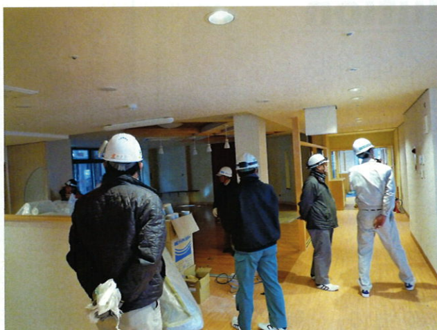
完成間近の現場視察の様子

研修後は参加者の意見交換や交流をかね、一緒に昼食を取るなど、大変有意義な研修となりました。