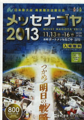
2013.11.13~16 メッセナゴヤ 2013