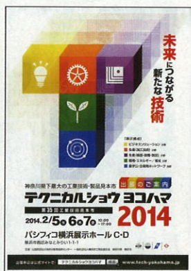
2014.2.5~7 テクニカルショウヨコハマ 2014