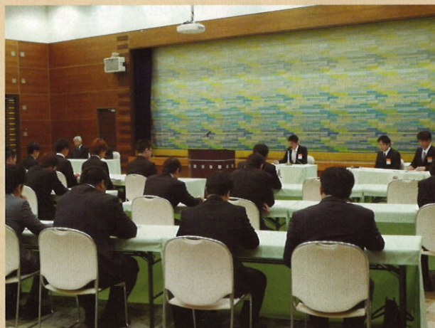
県青連上伊那支部総会

しかしながら私を含めまだまだ未熟者の集まりですので、どうか温かい目で見守り、ご指導・ご協力いただきたいと思います。どうぞよろしくお願いいたします。