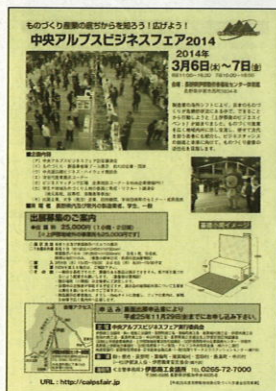
2014.3.6~7 中央アルプスビジネスフェア 2014

工業部会では、町内企業様のビジネスチャンスの増大と、情報収集の場所として様々な展示商談会に出展支援しております。当日はぜひご来場ください。