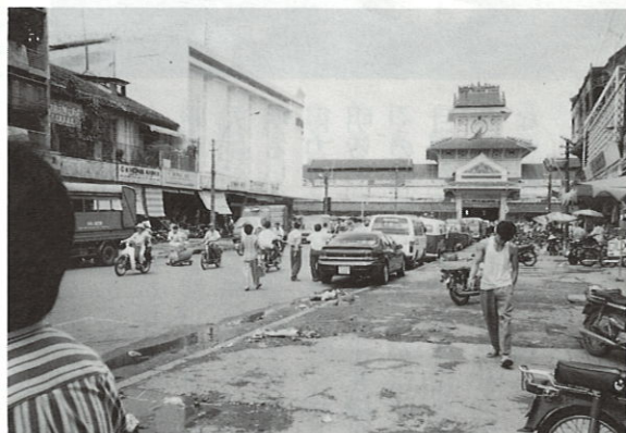
〔ホーチミン市街風景〕

二日目は皆と行動を共にし、チョワン地区のビンタイ市場まで市内バスにて行きました。(3,000ドン、約30分1ドル11、000ドン)ここはサイゴン地区のペンタイン市場ほど観光客擦れしてないとのこと、確かにいい意味でこちらを無視してくれてベトナムノという感じの食品を見て嗅いで来ました。1m程の路地の両側に