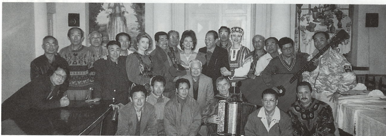
〔ロシア民謡を楽しんで〕

を呑み、家庭料理を楽しみながら話はずんだ。私の訪問した家は白系のロシア人で背の高い素晴らしい女性だった。日本語も上手で日本に留学したいとのことだった。一般の労働者の賃金は日本円で六千円