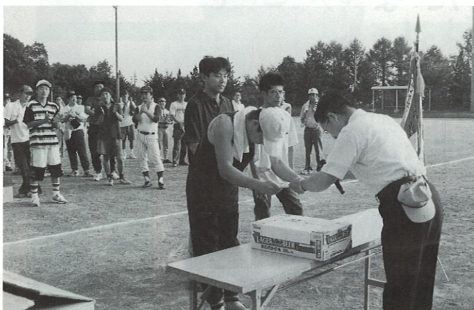
〔松島北が見事に優勝〕

も早く、各会社の社員、部会員同志の交流も深く行なわれ、二部の部も大いに盛り上げていただきました。 今の建設関係を取り巻く現状は大変に厳しい時ではあります、それぞれの皆様方の協力を頂き、有意義な一日でありました。