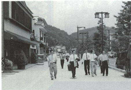
しょうにん通り商店街視察

「沿道区画整理型街路事業（土地画整理事業）」の導入を決定したあと、昭和六十三年に地区内関係者全員の同意書を県に提出、平成四年に同事業