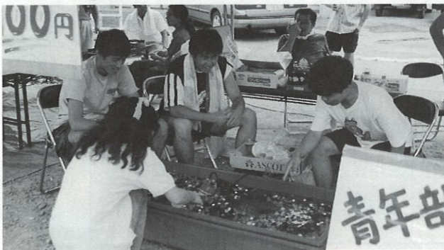
スパーボールすくい

この収益金と部員からの募金により、社会福祉協議会へ車イス一台を寄贈させていただきました。