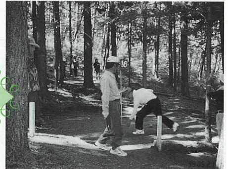
長田マレットゴルフ