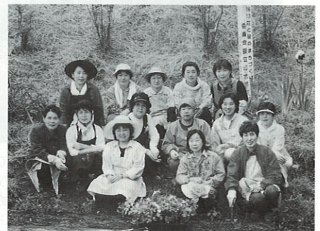
花植えを終えて…ハイポーズ!

ネルの開通が待たれていた飛 騨高山へ、部員四十六名の参 加にてAM七時に出発。先ずは 十時より宮川朝市の見学を行 う。出発時の雨も上がり足取 り軽く散策。新鮮な野菜や民 芸品が並ぶ。また、飛騨名物