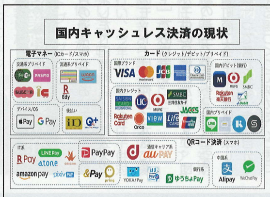
キャッシュレスカオスマップ