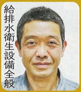
給排水衛生設備全般