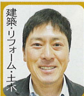
建築リフォーム・土木