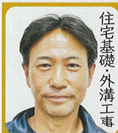
住宅基礎・外溝工事

今後、この難局を会員の皆様、地域の皆様とともに乗り越え建設業部会の発展に尽くしてまいりたいと思っております。今年度、新たに建設業魅力発信事業への取り組み、建設業の担い手確保に知恵を出し合い、若年者への人職促進に向けた取り組みも行ってまいります。三年間どうぞよろしくお願いいたします。