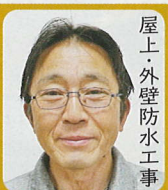
屋上・外壁防水工事