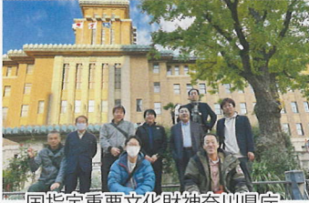
国指定重要文化財神奈川県庁