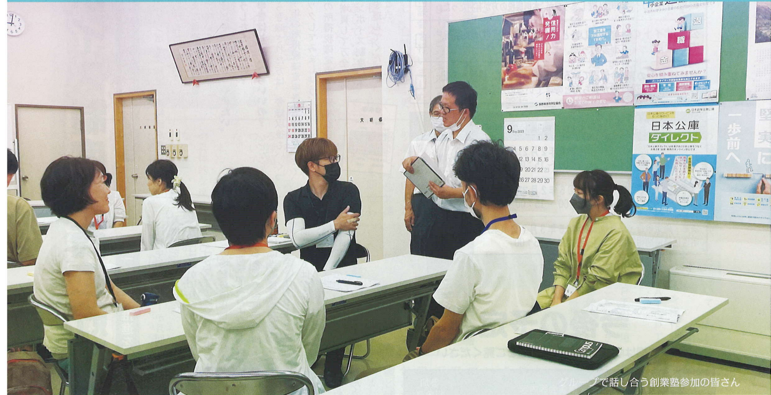
で話し合う創業塾参加の皆さん